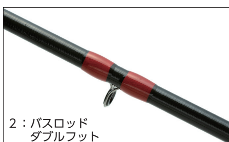
2：バスロッド ダブルフット