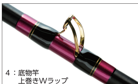
4：底物竿 上巻きWラップ