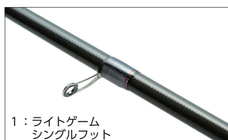
1：ライトゲーム シングルフット