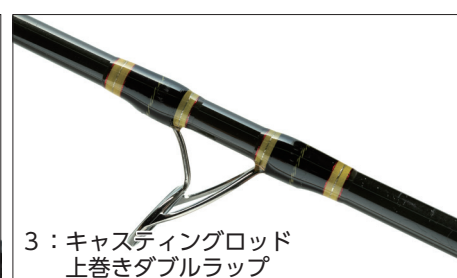
3：キャストイングロッド 上巻きダブルラップ