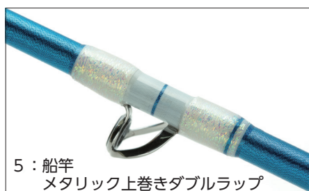
5：船竿 メタリック上巻きダブルラップ