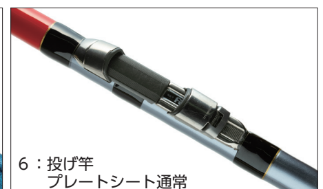
6：投げ竿 プレートシート通常